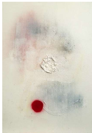
Technique mixte sur toile, 2017, 70 x 50