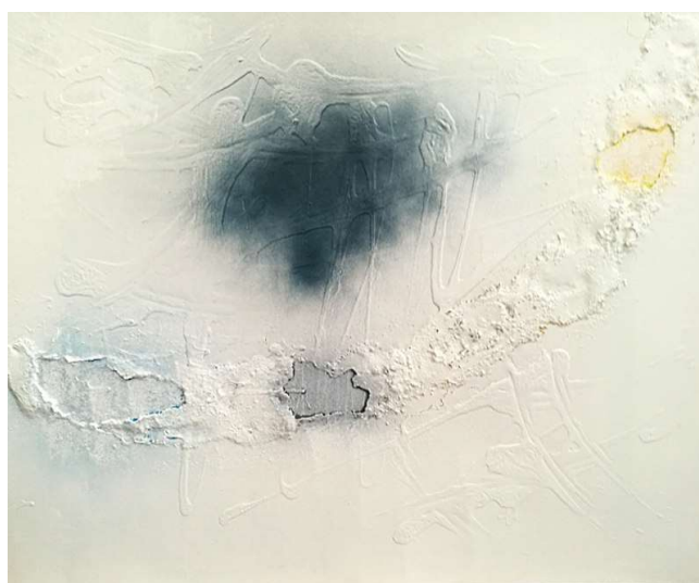
Technique mixte sur toile, 2017, 60 x 73