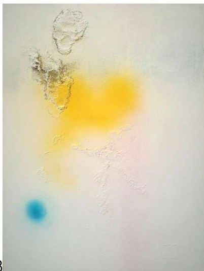
Série - ' Lumière voilée I '

La série ' Lumière voilée ' raconte la volonté de l'artiste de retranscrire le va-et-vient entre la nature intacte et l'humain qui s'y mêle. Le moteur de la création pour Bargeon vient de l'ancrage de la vie citadine et contemporaine dans les sources naturelles, l'individualité en rapport avec le groupe et l'environnement. La luminosité du blanc - couleur qui évoque chez l'artiste la pureté, la gaité, la simplicité... absolue - se laisse voiler de l'intérieur comme de l'extérieur par des intrusions de couleurs. L'éclatement lumineux derrière une couche nuancée suggère la dynamique du parcours visuel et imaginaire de ceux qui le contempnent.