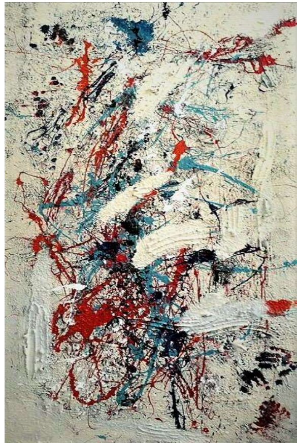
Technique mixte sur carton, 2017, 195 x 95