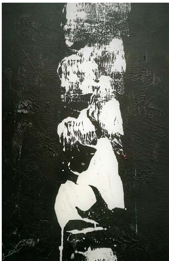
Acrylique sur carton, 2017, 80 x 50