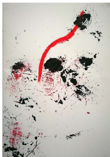
Acrylique sur papier, 2017, 42 x 29.7