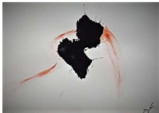
Acrylique sur papier, 2017, 29.7 x 42