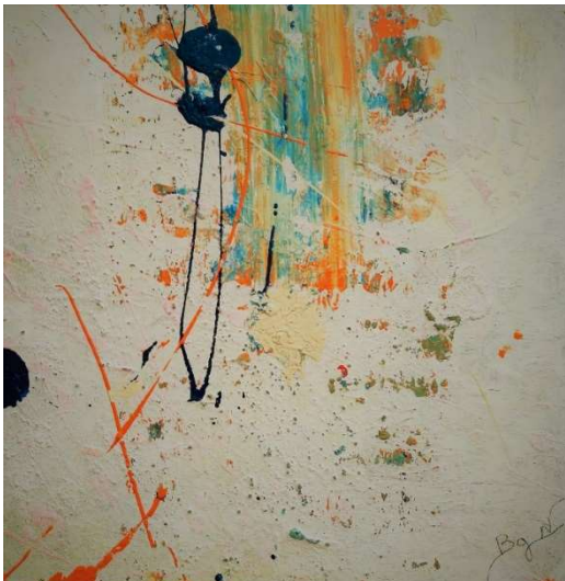
Technique mixte sur carton, 2017, 40 x 40

Visite amateurs d'art et presse. Contactez-nous :