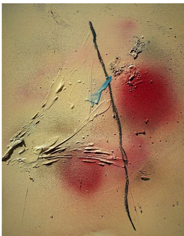
Sans titre n°25, 2017, techniques mixtes, 40 x 50