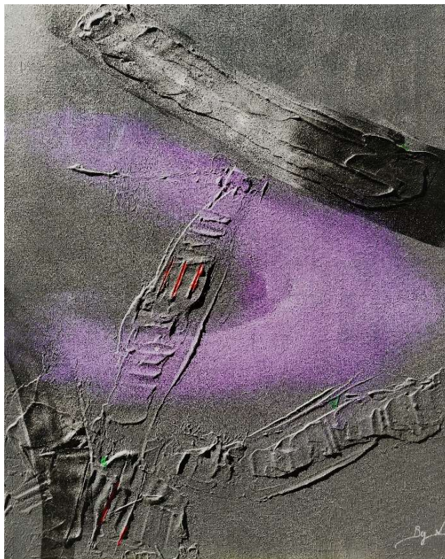
Sans titre n°15, 2017, techniques mixtes, 81 x 65