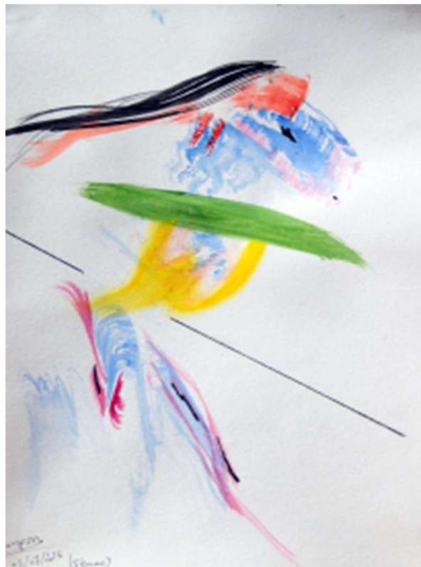
En pelisse écarlate ou en complet 3 pièces safrané, la population sous-marine des lagons sechamaille et s'encanaille n°6, 2016, aquarelle, crayon de couleur et pastel à l'huile sur papier 29 x 21