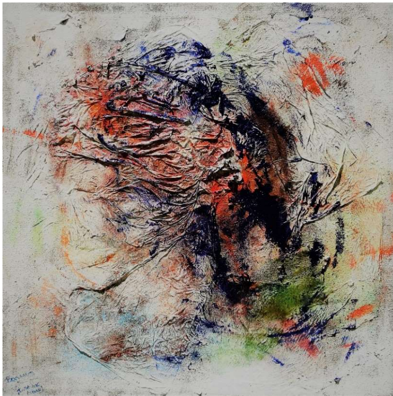
Cycloniques, voyage en hémisphère sud, 2016, 100 x 100