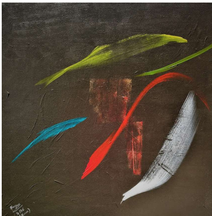
Comme l'âme intense de la Réunion, voyage en hémisphère sud, 2016, acrylique, 100 x 100