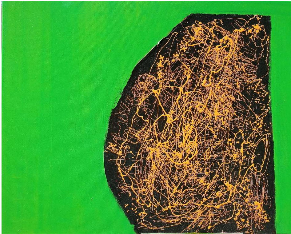
Sans titre n°1, 2017, acrylique sur toile, 100 x 80