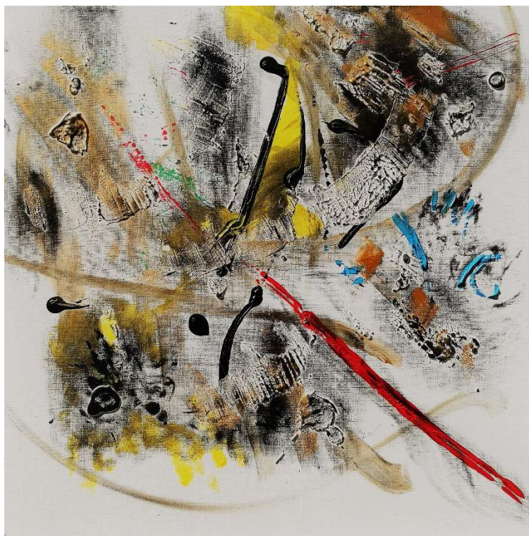
Sans titre n°11, 2017, techniques mixtes, 80 x 80