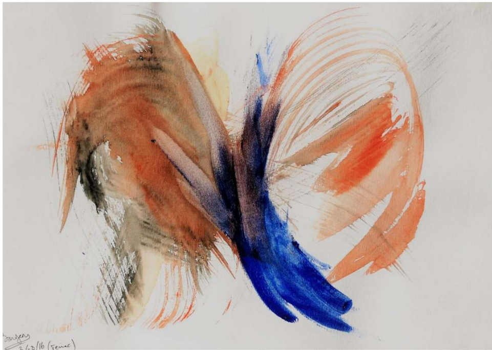
En pelisse écarlate ou en complet 3 pièces safrané, la population sous-marine des lagons sechamaille et s'encanaille n°5, 2016 techniques mixtes, 21 x 29,7